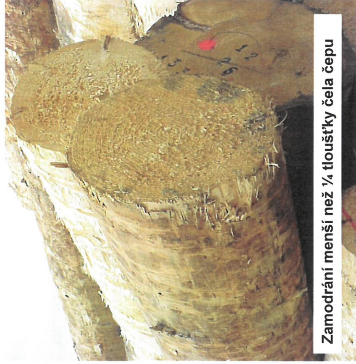
Zamodráání menší než ¼ tloušťky čela čepu

„čisté“ (nezamodralé), ale prokazatelně kůrovcové dříví