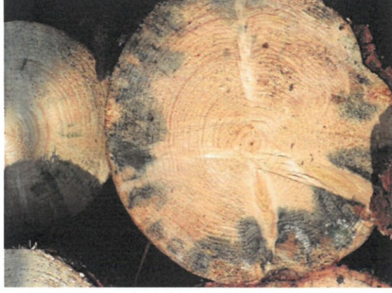
Zamodrání větší než 1/4 tloušťky čela čepu a počínající paprsky hniloby!