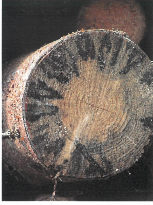
Zamodrání větší než 1/4 tloušťky čela čepu